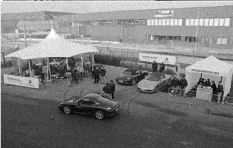
Nelle foto, due momenti della manifestazione organizzata, la settimana scorsa, dal Centro Porsche Como presso il Mokart di Montano Lucino