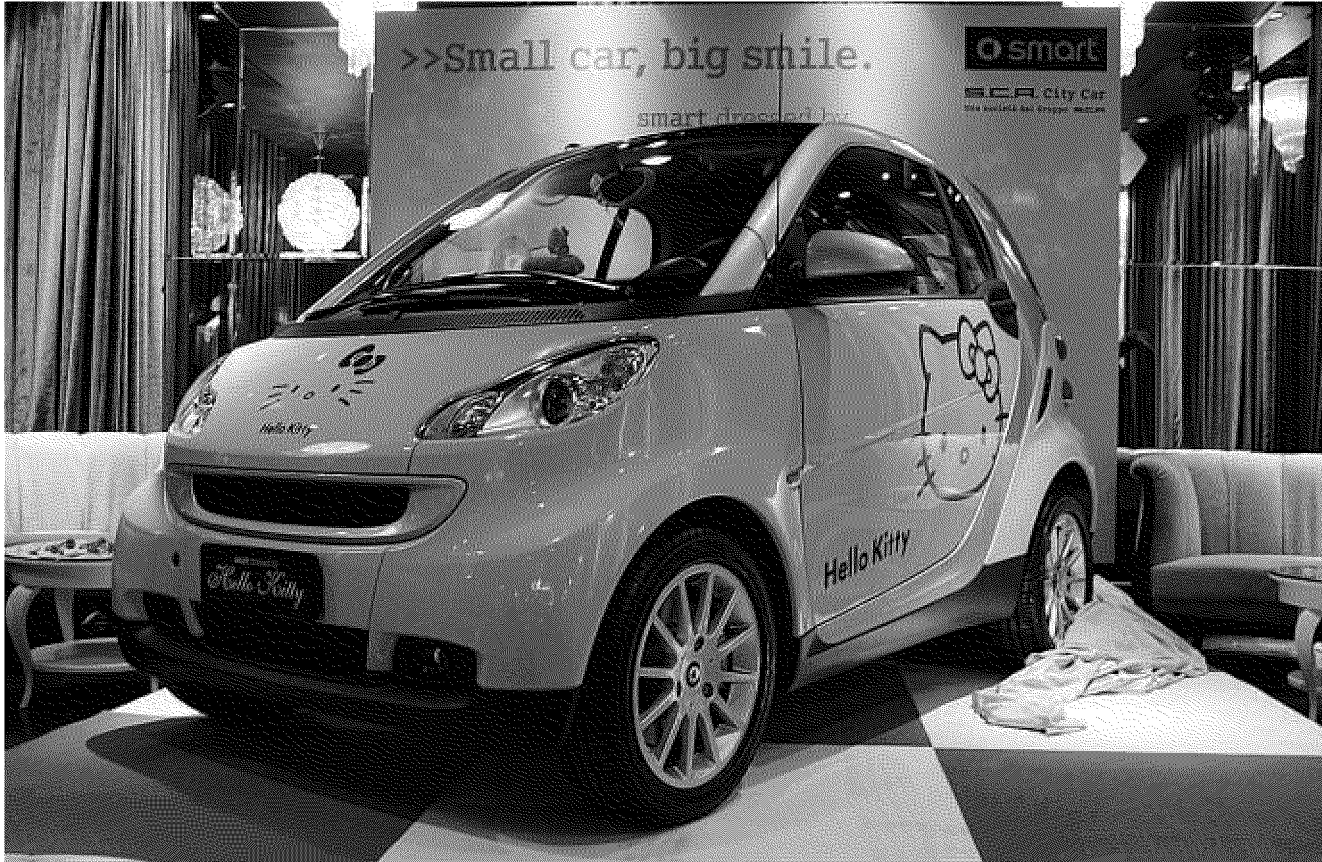
Alcune immagini della simpatica Smart dressed by Hello Kitty presentata dalla concessionaria SCA