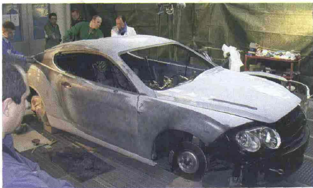
■ Ecco alcune fasi delle lunghe operazioni di verniciatura (350 ore) della Bentley firmata Zagato: solo la lucidatura ha richiesto 70 ore!

▶ In occasione del Salone Top Marques di Monaco (Montecarlo), è stata presentata la Supercar Spada TS Codatronca. L'auto, disegnata e progettata presso lo Studio Spadaconcept di Moncalieri (TO), è stata prodotta da SpadaVettureSport in collaborazione con un team di partner tecnici tra cui PPG, che si è occupata della creazione dei colori e dell'intero processo di verniciatura dell'auto. Le operazioni sono state effettuate presso la carrozzeria Francesconi di Torino con prodotti di ciclo PPG; la finitura è stata fatta con Envirobase High Performance all'acqua e con i trasparenti D841 e D813, il nuovo trasparente opaco. La maggior parte della carrozzeria è stata verniciata con un grigio antracite, che fa risaltare le linee altamente tecnologiche della vettura. Il colore è stato appositamente creato dal Centro Stile PPG di Quattordio e formulato, in versione lucida e opaca, dal Laboratorio Colore di Lainate. Alcune piccole parti della carrozzeria sono state realizzate con il grigio 601 Fiat sia lucido che opaco, e altri dettagli con grigio titanio 398 Fiat. Per i colori dell'interno sono stati impiegati l'alluminio Fiat 620 e il grigio titanio Fiat 398. ◀