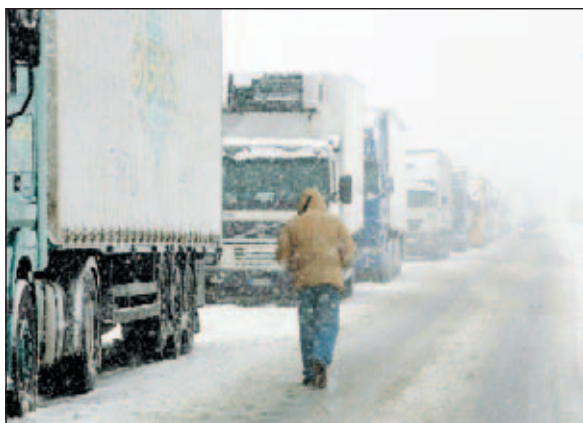
Colonna di tir sotto la neve sull'A21

Inoltre la polstrada, vista la stagione fredda e in caso di ne-