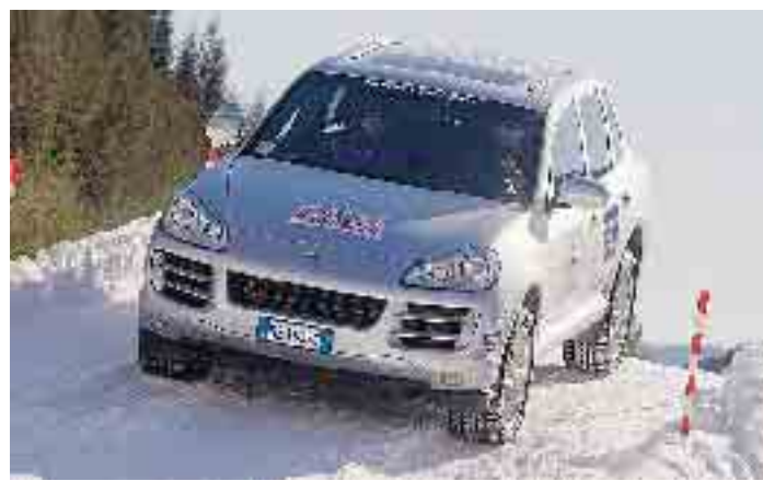
Le neviccate di questi giorni hanno aiutato a capire l'importanza delle gomme invernali

Presto, però, la norma che consente l' "equipaggiamento misto" dovrebbe essere cambiata e la possibilità "legale" di finire fuori strada eliminata.